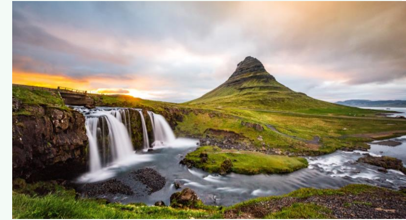
Kirkjufell í Eyrarsveit að sumarlagi

Olíuverzlun Íslands ehf. hefur kolefnisjafnað rekstur sinn með mótvægisaðgerðum í samstarfi við Landgræðsluna. Samtals mótvægisaðgerðir jafngilda 2.380 tCO 2 i.