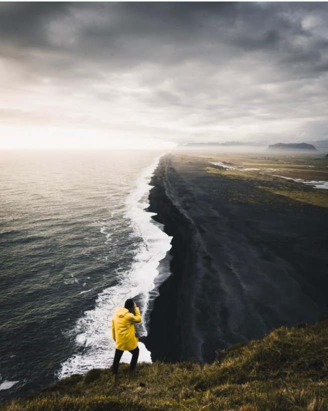
Horft yfir Reynisfjöru við Vík í Mýrdal