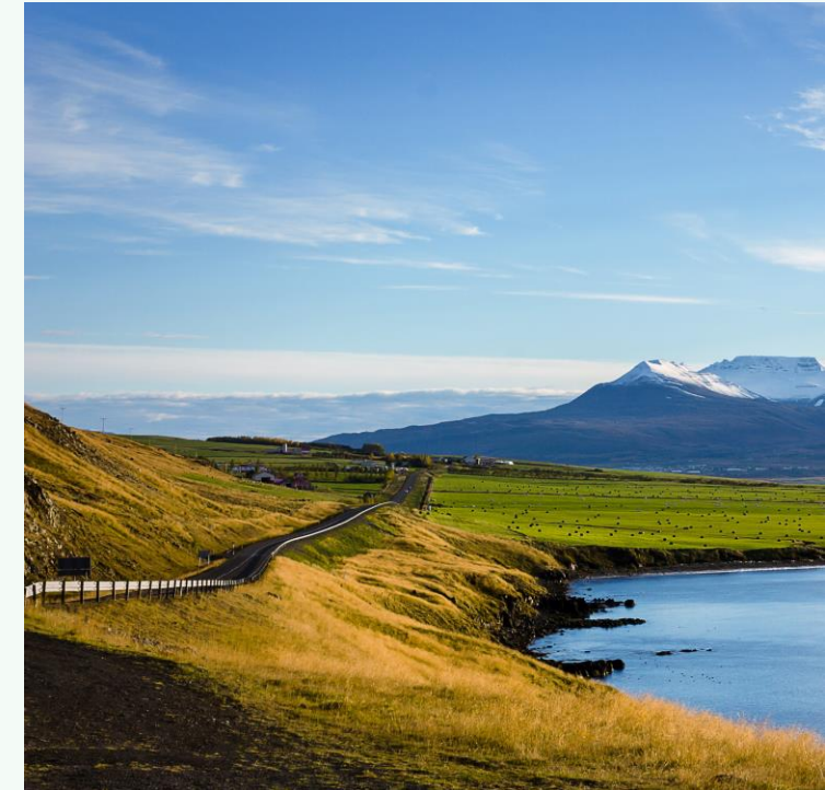
Eyjafjörður í átt að Akureyri

Við leggjum áherslu á að fara í einu og öllu eftir lögum og reglum í starfsemi okkar með gagnsæi og siðgæði að leiðarljósi. Sala á jarðefnaeldsneyti er háð lögum og reglum um losun gróðurhúsalofttegunda og við blöndum endurnýjanlegu eldsneyti (ethanol í bensín, biodisel í diselolíu) saman við hefðbundið eldsneyti til að uppfylla lög og reglur um minni losun gróðurhúsalofttegunda. Olís starfar eftir og uppfyllir reglugerð um gæði eldsneytis en markmið þeirrar reglugerðar er að draga úr losun gróðurhúsalofttegunda á vistferli eldsneytis og hugsanlegum skaðlegum áhrifum eldsneytis á heilsu fólks og umhverfisins.